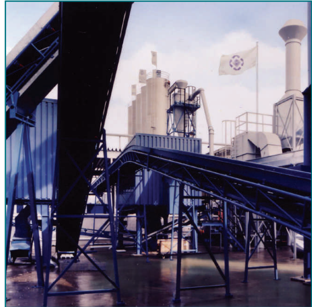
Planta de reciclaje VEKA UT, en Behringen, Alemania

La tecnología de reciclado con la que opera esta planta ha sido completamente desarrollada por VEKA y es un ejemplo del buen hacer, como lo puso de manifiesto la Dirección General XIII de la Comisión Europea (Medioambiente) durante una visita a las instalaciones.